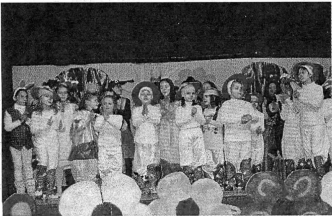
SEDICO - Una delle scene di Cenerentola.

Bambini e genitori insieme per mettere in scena Cenerentola e la Carica dei 101. È accaduto a Sedico, l'altro pomeriggio, nel salone-teatro dell'ex Casa della dottrina di Sedico ora inti-